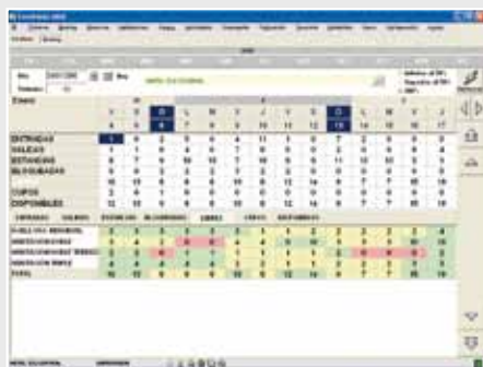
Pantalla de Booking