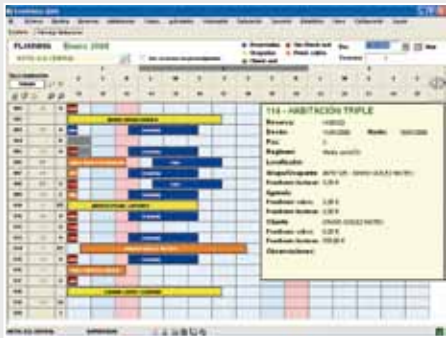
Planning de habitaciones