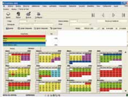
Calendario gráfico de aplicación de precios